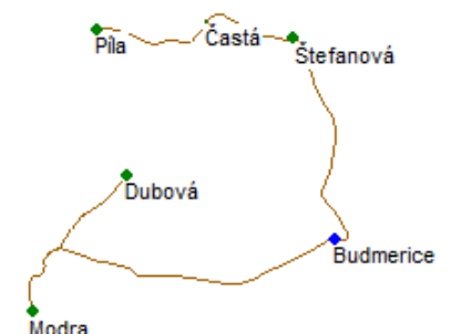
Riešenie pre ohrozenú obec Budmerice